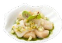
Крудо из свежего гребешка (с сальсой из огурца с зерновой горчицей) 1/40