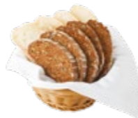
Хлебная корзина из свежеспеченного хлеба 1/50