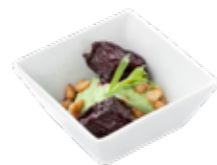
Вяленая свекла, заправленная гранатовым соком (со сливочным кремом из эстрагона) 1/40