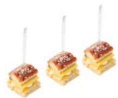
Канapé с угрем и манго на коврижке 1/20