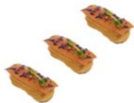
Эклер с лососем (топленой грушей и творожно-лаймовым муссом) 1/30