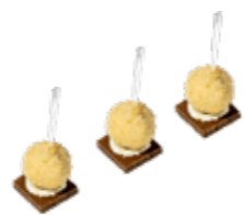
Сырное рафаэлло с фиником «Блючиз» 1/20