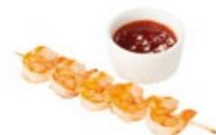
Шашлычок из тигровых креветок (со сладким соусом чили) 1/50