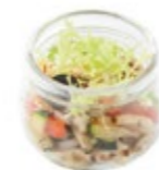
Салат с кальмарами и овощами (приготовленными на гриле под соусом из свежего кориандра) 1/50