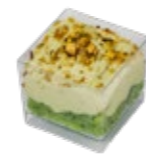
Нежный фисташковый десерт с крем-чиз и зелёным спонджем 1/40