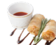
Блинчики спринг-ролл (с телятиной в сливочно- кунжутном соусе) 1/100