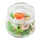
Чука салат (с копченой индейкой и ореховым соусом) 1/50