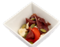
Вяленая вырезка из оленя (с печеным болгарским перцем и страчателлой с тыквенными семенами) 1/40