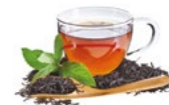
Кофе заварной или чай черный / зеленый 150 мл