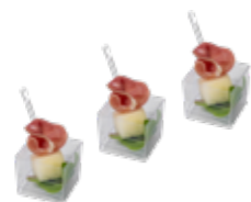
Канapé с хамоном и дыней в шоте 1/20